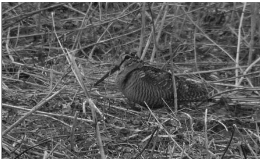
Megbecsülni lehetetlen, lefotózni is nagyon nehéz.