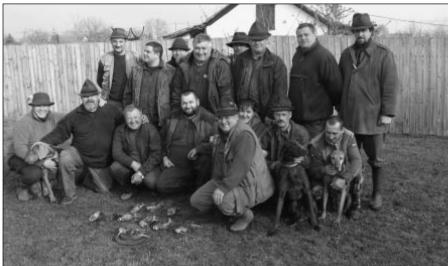
Szegedi Fanatikus Szalonkázók