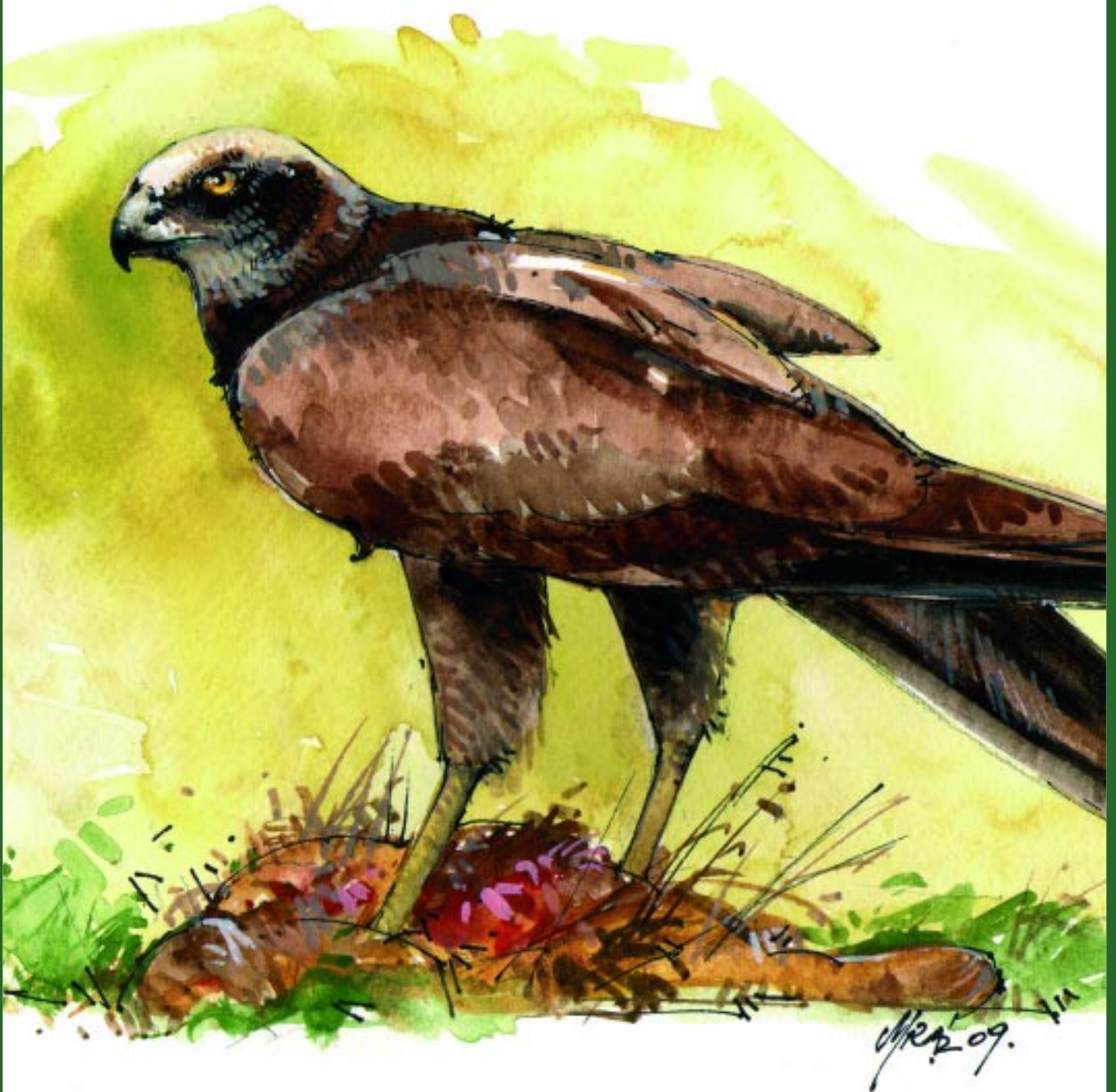
Mráz János festménye

Csongrád Megyei Vadásznapi Mórahalom, 2009. július 5.