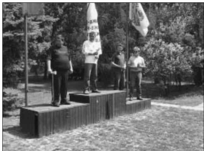
Az első forduló helyezettjei

OMVK Csongrád Megyei Területi Szervezet Elnöksége Csongrád Megyei Vadászszövetség Elnöksége